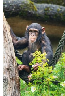
CASA DELLE SCIMMIE

Dopo le visite guidate avrete tempo a sufficienza per soffermarvi e visitare altri recinti.